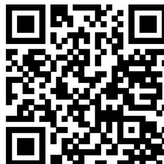
รายงานความยั่งยืนแบบบูรณาการ